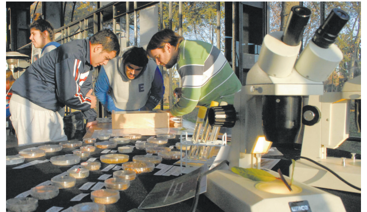
Muestra interactiva TecUNNOBA

Se realizaron las III Jornadas de Jóvenes Investigadores con la