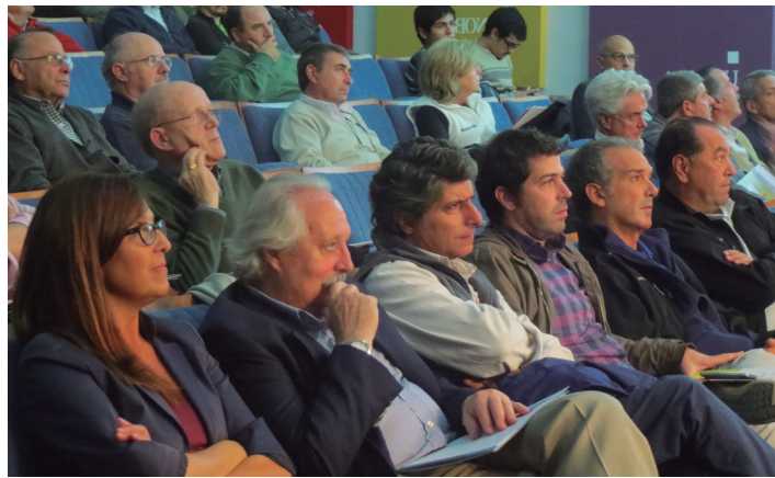
Encuentro del Cluster de Semilla

exposición de 80 posters en 10 disciplinas.