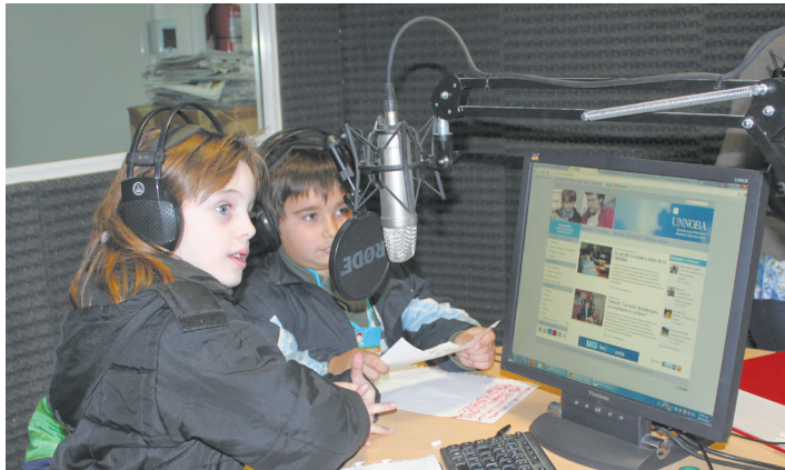
Talleres de vacaciones de invierno para los más chicos

Este año se realizaron dos Jornadas Institucionales con la participación de docentes, estudiantes, no docentes, investigadores, extensionistas y autoridades de la Universidad, con el objetivo de definir líneas de trabajo orientadas a la mejora institucional y a la concreción del Plan Estratégico.