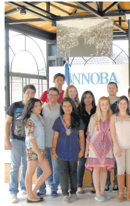
Estudiantes extranjeros junto al Rector

Con el objetivo de acercar la Universidad a los alumnos de la zona de influencia de la Universidad se realizó la Muestra Interactiva TecUNNOBA en las localidades de Junín, Chacabuco, Lincoln y Pergamino. La actividad, destinada a estudiantes de los dos últimos años de la escuela secundaria, tiene como objetivo presentar las producciones realizadas por docentes, estudiantes e investigadores en el marco de las diferentes carreras. Esto posibilita la apertura de la Universidad a los actores educativos, así como la