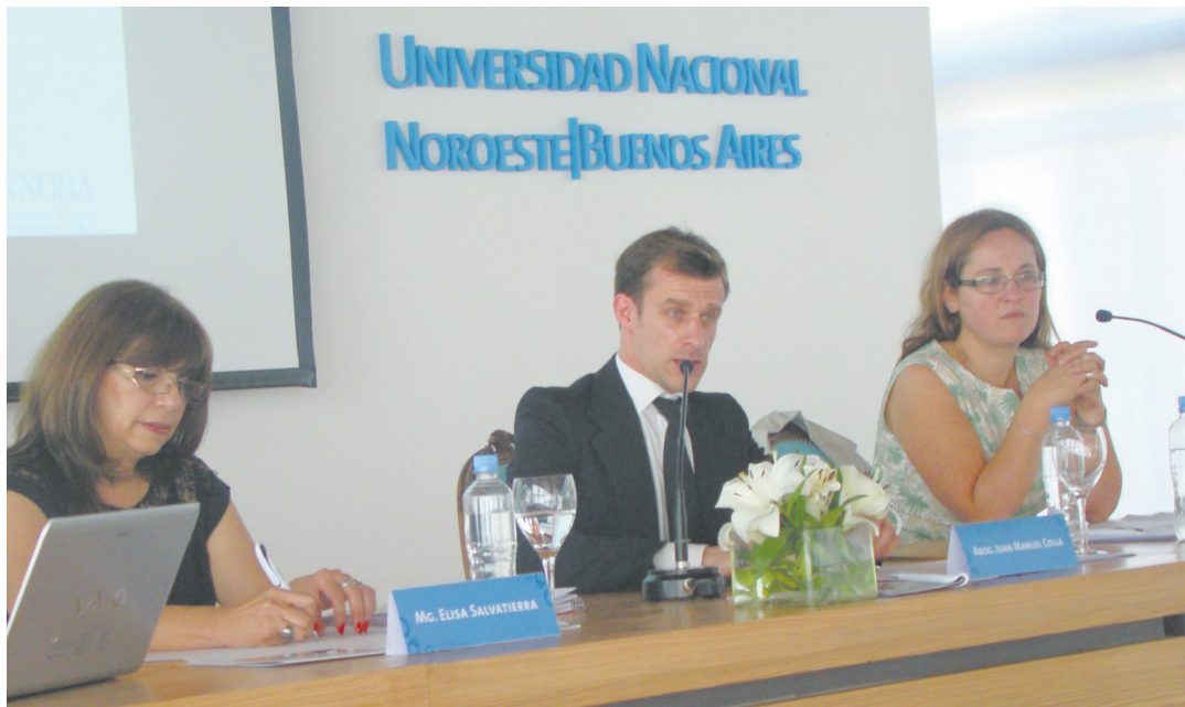
Especialistas disertaron sobre el acceso a la salud en el marco del derecho constitucional