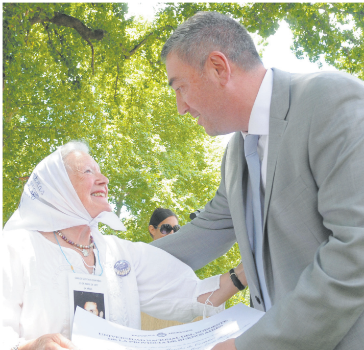
Nora Morales de Cortiñas, visitante ilustre