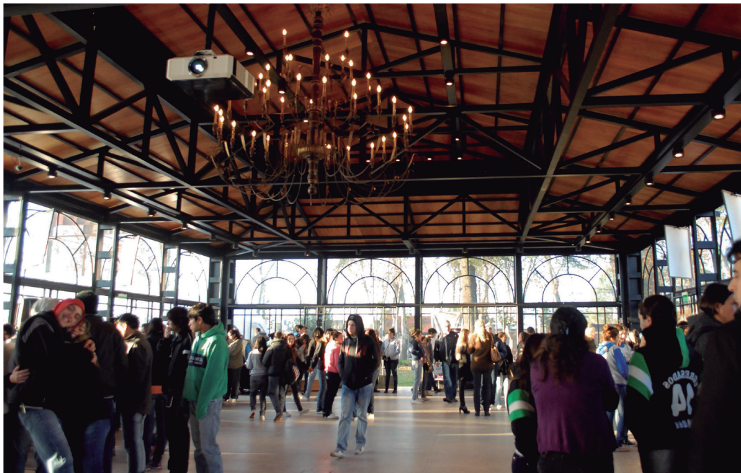
Estudiantes de la secundaria en el Salón de la Democracia Argentina