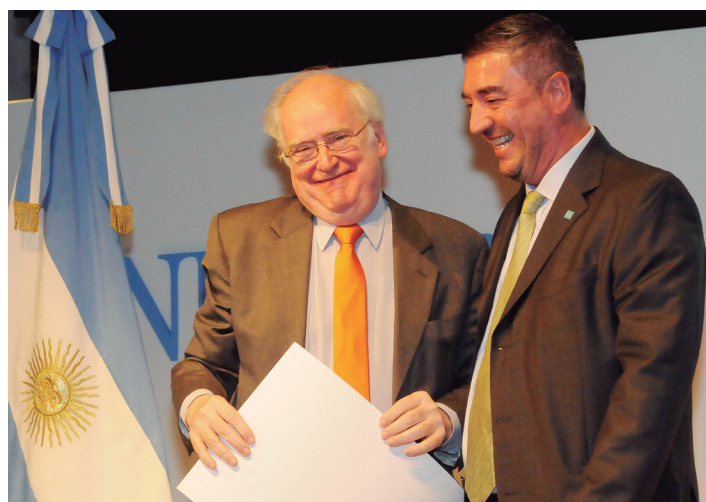
Guillermo Jaim Etcheverry, doctor Honoris Causa

Se realizó la segunda etapa de acreditación de las carreras de