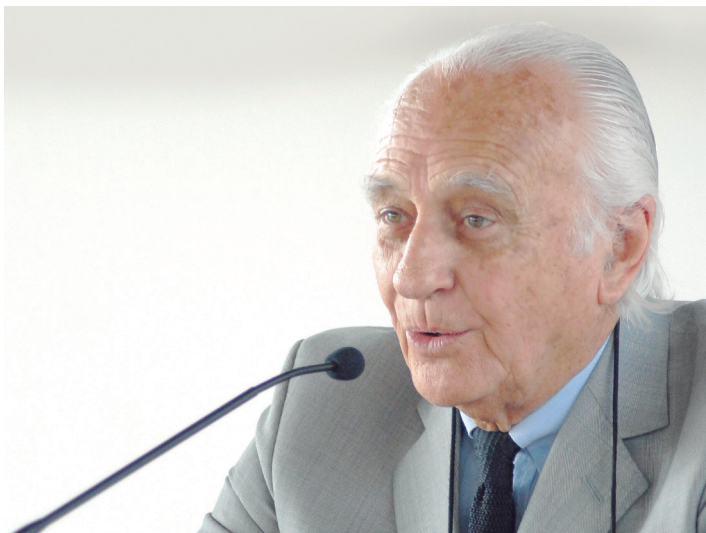
Según Lima, la gratuidad distingue al sistema universitario argentino.

- ¿Qué significado tiene para la UNNOBA el proceso de elección de autoridades y el inicio de una nueva etapa institucional?