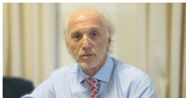
El psicoanalista dictó una clase en el inicio del posgrado.

Fainstein destacó las tareas que realiza la APA desde el “Centro de Investigación y Orientación Enrique Racker”, donde se “brinda orientación asistencial psicoanalítica en forma gratuita y se atiende a la población carenciada”. Desde el centro “Racker”, por ejemplo, se está ofreciendo ayuda a familiares y víctimas de la tragedia ferroviaria de Once.