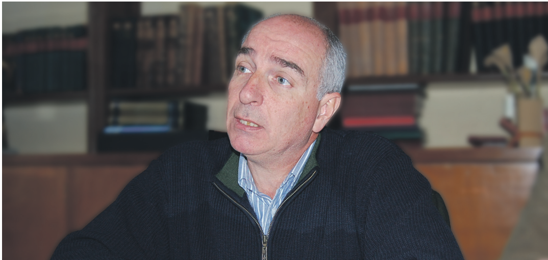
Pacífico coordina el taller abierto a la comunidad.

El docente planteó la importancia de tomar contacto con miradas