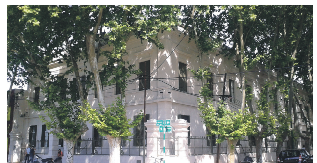
María Eva Duarte de Perón, otro de los edificios históricos recuperados.