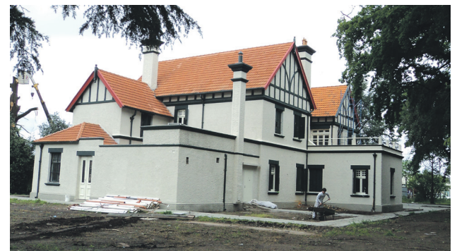
Reforma Universitaria, edificio emblemático de Junín restaurado por la UNNOBA