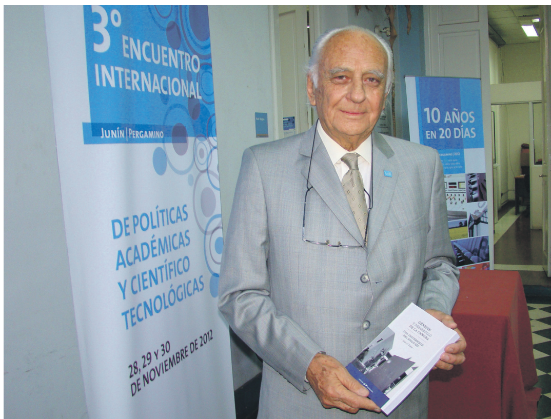
Se presentó el libro en el marco del III Encuentro Internacional de Políticas Académicas y Científico-Tecnológicas.

El ex rector organizador se remontó a la creación de los Centros Universitarios de Junín y Pergamino, espacios en los que “se empezó a crear lo académico”. “La universidad empieza a gestarse