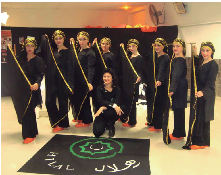
Una muestra de danza árabe.