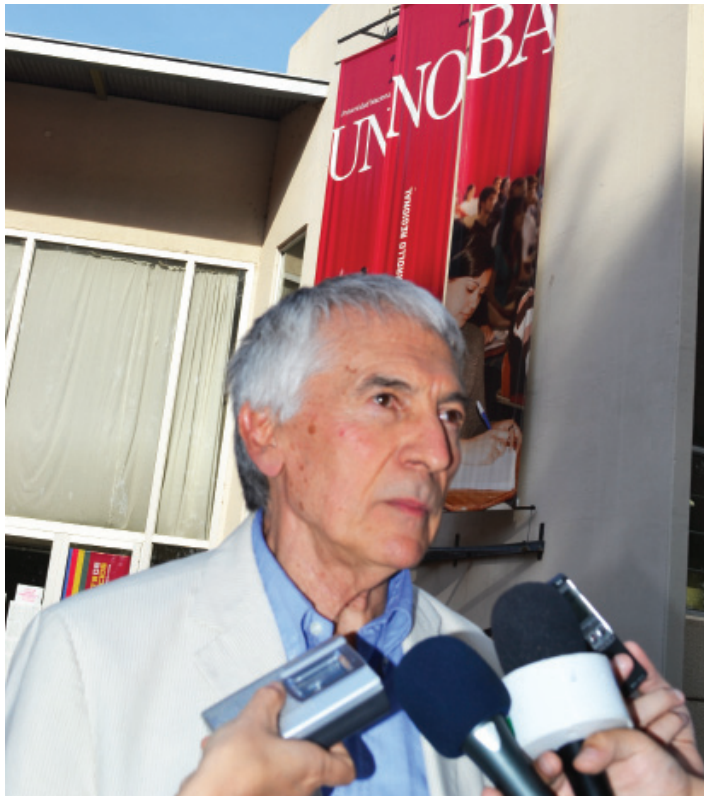
Frascara planteó que el diseño gráfico es fundamental para resolver múltiples situaciones.

“Es necesario jerarquizar el diseño de información, un área de competencia estratégica para