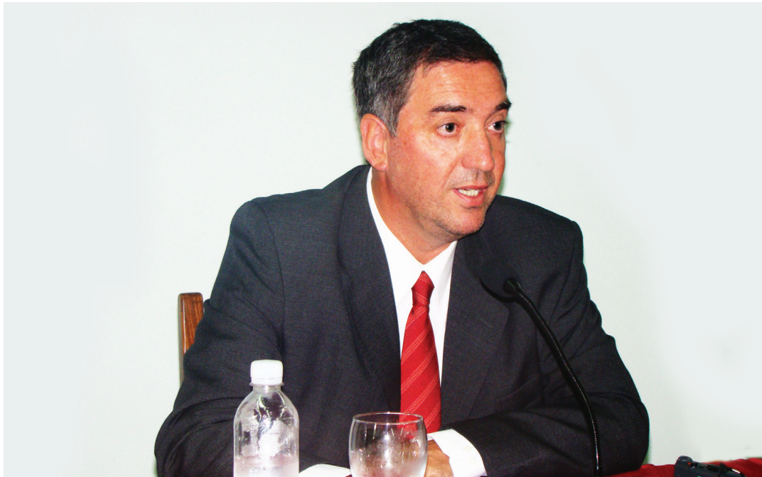
Tamarit apunta a la transformación del sistema productivo local, con producción diversificada e innovadora, que garantice a la vez la sustentabilidad ambiental

Las limitaciones a transformar este crecimiento en desarrollo, están dadas (entre otras) por dos cuestiones fundamentales. Por un lado, a falta de infraestructura adecuada para mejorar la calidad y ampliar las potencialidades del proceso productivo (la falta de puertos y la renovación de los actuales, problemas recurrentes en la provisión de energía, falta de autopistas y comunicaciones adecuadas, recurrentes problemas en los servicios de transporte, entre otros). Por el otro, la falta de recursos humanos capacitados para poner en marcha esta nueva etapa.