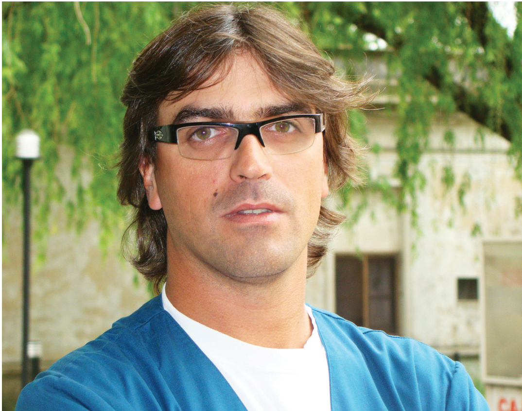
Mauri brindó pautas para una correcta salud bucal.

"La periodontitis comienza con inflamación e infección de los tejidos de sostén del diente [encía, ligamento periodontal], continúa con la afección al hueso y culmina con la pérdida dentaria", explicó Mauri al describir el proceso de la enfermedad, la que se encuentra, según el especialista, dentro de "las grandes patologías de la boca".