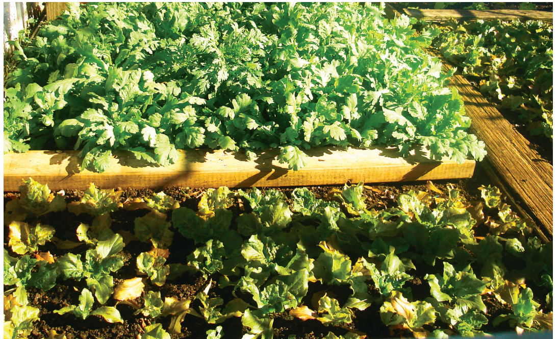
Se propone un enfoque análogo al de la agricultura orgánica.

Eso ha conducido a un proceso de gran concentración. Así, por ejemplo, en 2007, el 2 % de los establecimientos más grandes en USA, acapararon el 59% de la venta total de productos provenientes del campo. Las grandes empresas incrementaron rápido