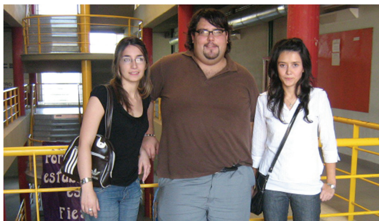
Primeros graduados de la carrera, en 2009.