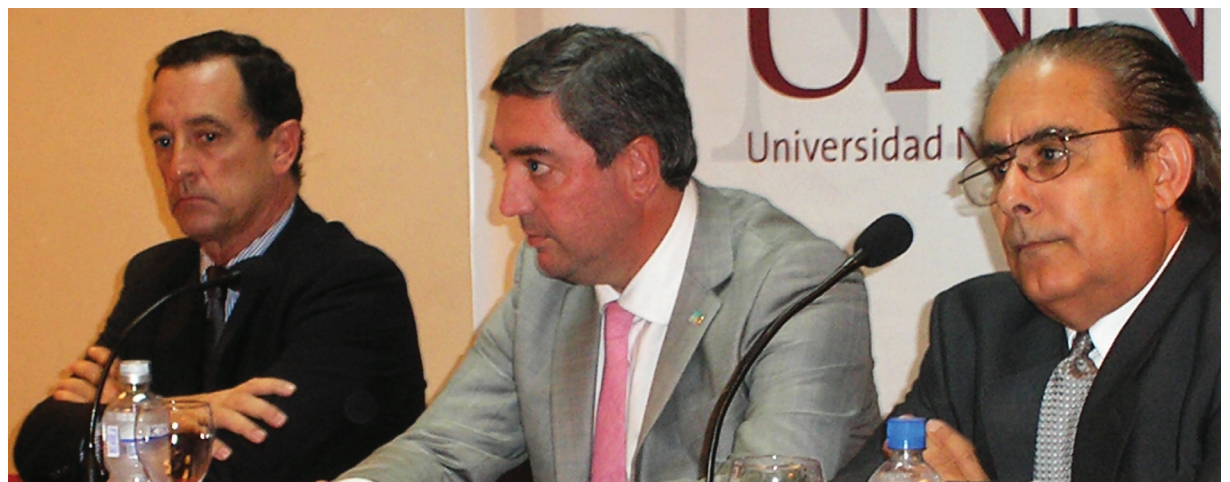
Intendente de Pergamino, rector de la UNNOBA y director del Centro Regional BA Norte INTA