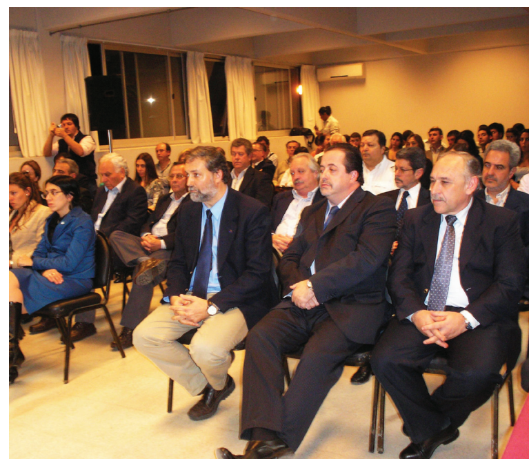
Representantes de las entidades firmantes siguieron atentamente la ceremonia.

La puesta en marcha del Polo Tecnológico Pergamino tendrá otra impronta, vinculada a las acciones